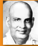
Swami Sivananda 1887 – 1963